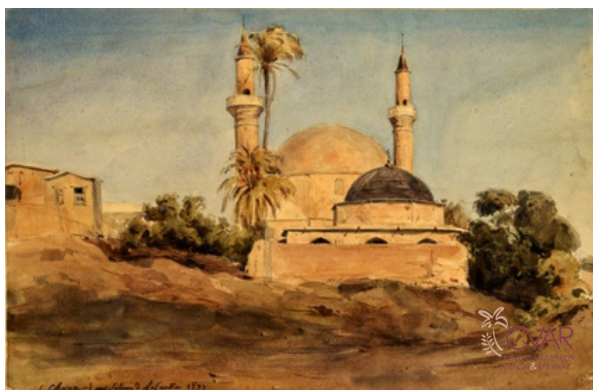
Άγνωστος, Αλικές στη Λάρνακα, 1837