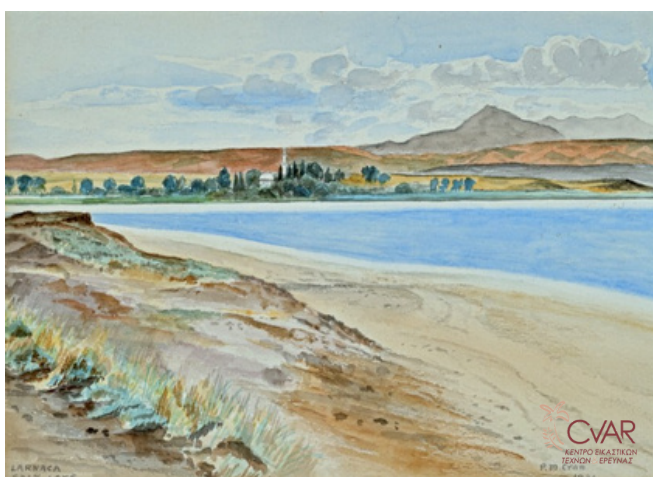
Cram, Αλυκή της Λάρνακας, 1936