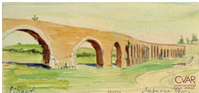
Olga Raouf, Το υδραγωγείο, 1930