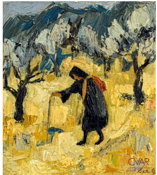
Perpetua Pope, Μεγάλη γυναίκα, 1963