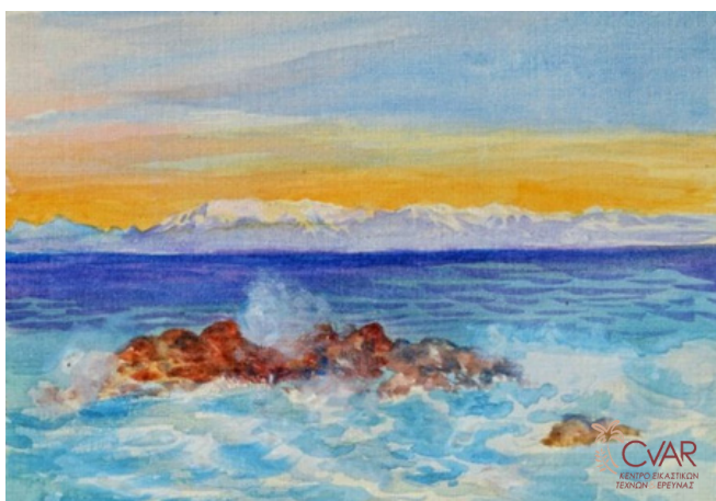
Allan Balfour, Ανατολή, 1938