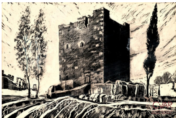
Brinkley, Κολόσσι, 1956