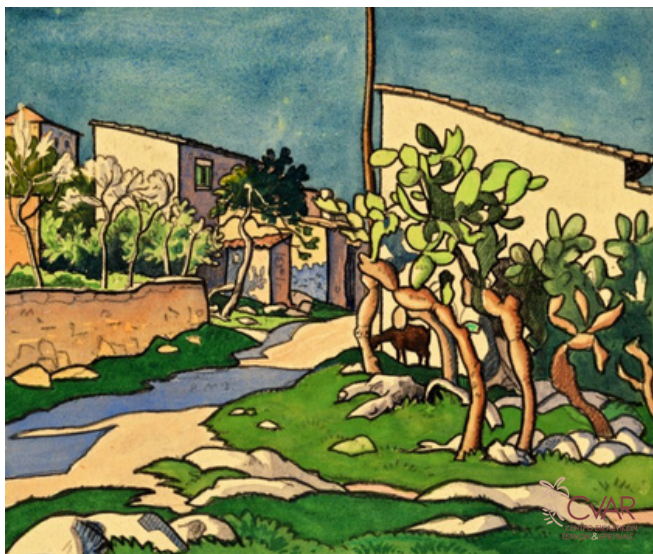
White Ethelbert, Κυπριακός κάκτος, 1950